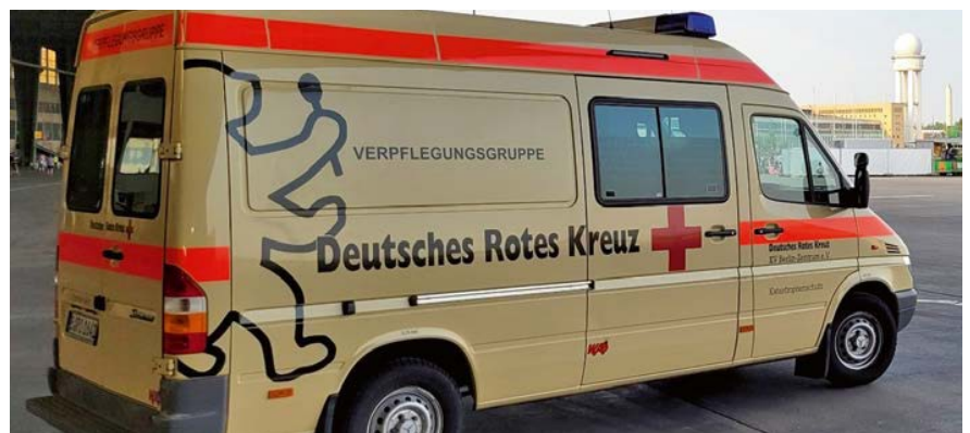
Das neue Fahrzeug der Verpflegungsgruppe

In mehr als 1.000 ehrenamtlich geleisteten Arbeitsstunden wurde der KTW nahezu vollständig entkernt. Tragetische und Halterungen wurden entfernt, nur der Schubladenschrank und die Sitzbank durften bleiben. Anschließend erweiterte ein Fachbetrieb die Elektrik: Eine verbesserte Innenraumbeleuchtung und Steckdosen wurden eingebaut, außerdem erhielt das Fahrzeug eine Umfeldbeleuchtung, eine Rückfahrkamera und eine Heckwarneinrich-