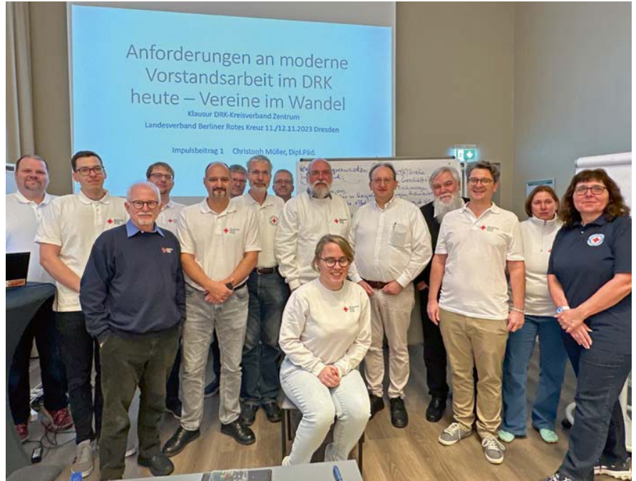
Der Vorstand auf Klausurtagung

Es wurde viel analysiert und diskutiert, aber auch an konkreten Lösungen gearbeitet und nächste Schritte definiert. Neben der inhaltlichen Arbeit kam auch die Gemeinschaft nicht zu kurz und am Samstagabend wurde ein Spaziergang in die Dresdner Innenstadt unternommen.